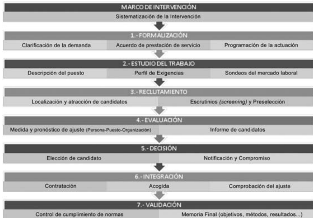
Gráfico 2.- Diagrama de hitos a alcanzar en los procesos de Reclutamiento y Selección

En cada una de ellas se especifican los productos derivados de las mismas. A continuación se aborda, en detalle, cada una de ellas